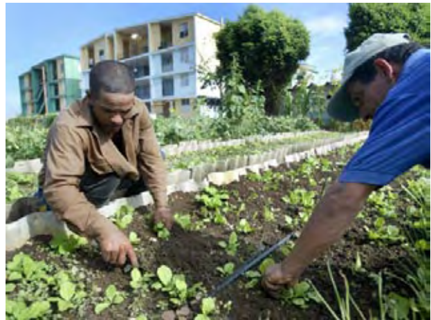
La insuficiente producción agrícola conlleva a importaciones por más de 1.000 millones de dólares.

La solución para algunas de esas trabas pudiera encontrarse en la decisión de dejar protegidos estatalmente los precios de 21 productos seleccionados, mientras que el resto podrá ser comercializado libremente, siempre y cuando se hayan cumplido las contrataciones con el Estado. “Yo no creo que nosotros