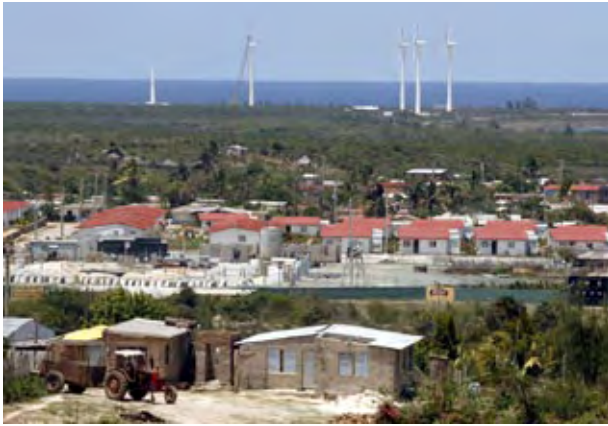
En 2010 se reportó un incremento en el consumo eléctrico en los hogares cubanos.

ción eléctrica. La capital cubana, que emplea 22 por ciento de la electricidad del país, más del doble de lo que gasta la segunda en consumo, Holguín (9,4% del total entre enero y junio, según datos de la ONE), gastó dos por ciento menos de electricidad con respecto a lo previsto en los primeros 10 meses del presente año.