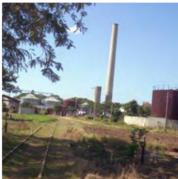
Ingenio azucarero desmantelado en la extinta provincia La Habana, como parte del proceso de reestructuración del sector emprendido a partir de 2002 y que redujo las tierras dedicadas a la caña y cerró más de la mitad de sus entonces 156 ingenios.

A juicio de los conocedores, revertir la crisis que desde hace años persigue a la agroindustria azucarera pasa por un análisis integral que incluya a los productores, que han sido muy ineficientes en los últimos cinco años, y la falta de estimulación al cañero, hoy día el obrero peor pagado en la agricultura. Según fuentes oficiales, “una hectárea de caña que suministra 50 toneladas recibe como pago 2,45 pesos; otros cultivos, en cambio, superan los 15.000 pesos por lo que cosechan en igual cantidad de tierra”.