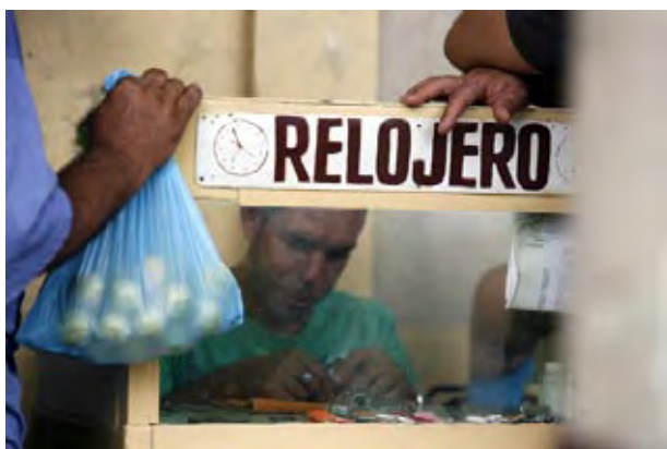
La modalidad de empleo por cuenta propia será una de las formas de trabajo para quienes queden excedentes.

Por el momento, dijo Valhuerdi, la entrega de autorizaciones para el ejercicio del trabajo por cuenta propia se mantiene limitada en nueve actividades (chapistero, fabricante-vendedor de artículos de granito y mármol, elaborador-vendedor de jabón, betún, tintas, sogas y otros similares; fundidor, herrero, oxicortador, productor-vendedor de artículos de aluminio, pulidor de pisos, y productor-vendedor de artículos de fundición no ferrosa). Esta prohibición se explica por la ausencia de un mercado lícito para adquirir la materia prima, aunque se estudian alternativas que lo viabilicen.