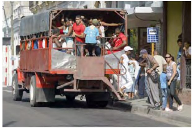
Las dificultades en el transporte constituyen una de las mayores insatisfacciones de la población.

Para evitar el colapso del transporte urbano, las autoridades de la capital cubana han adoptado la estrategia de mover vehículos de una terminal a cubrir otras rutas, lo que origina que haya menos disponibilidad de ómnibus, incluso en aquellas terminales donde funcionan equipos chinos, que muestran menos roturas. Además, se decidió que en los itinerarios más