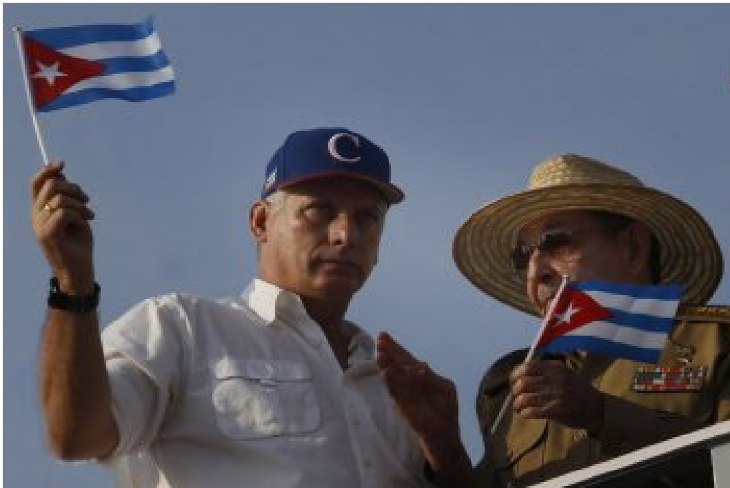
El Presidente cubano Miguel Díaz-Canel (I) junto al Secretario del Partido Comunista de Cuba (PCC) Raúl Castro.

No hubo sorpresas: el 19 de abril, el hasta ese momento primer vicepresidente de los Consejos de Estado y de Ministros, Miguel Díaz-Canel , fue investido como presidente, tras resultar el candidato único al cargo y recibir el voto casi unánime de los diputados que integran la Asamblea Nacional del Poder Popular (ANPP, parlamento unicameral). Además de nacer después de la revolución de 1959 y no ostentar grados militares, por primera vez el gobernante no dirige el PCC.