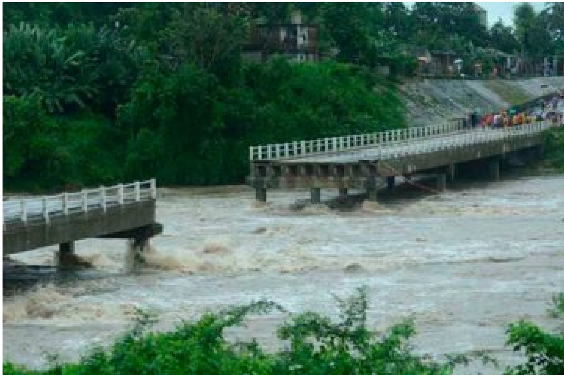
La tormenta subtropical Alberto provocó daños severos en varias provincias, las fuertes lluvias hicieron colapsar el puente del río Zaza en la central Sancti Spíritus.