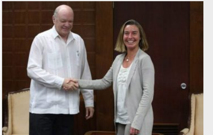
Federica Mogherini confirmó que la UE es el primer socio comercial, el primer inversor y el primer aliado en cooperación para el desarrollo de Cuba.

Aunque Cuba y la UE reconocieron que “subsisten profundas diferencias de posiciones y enfoques ” relativas a los derechos civiles y políticos, concordaron en que son muchas las áreas donde obtener resultados prometedores, como los intercambios culturales.