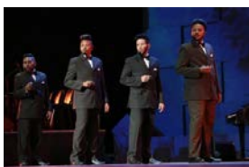
La realidad en cifras de las personas trans en Cuba.

A partir de convocatorias circuladas en redes sociales, los asistentes vistieron camisas, camisetas, blusas, chaquetas o pulóveres con colores de la bandera del arcoíris, que identifica al movimiento de personas LGBTI a nivel mundial.