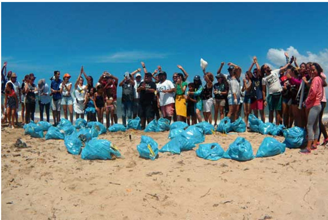
Limpieza de una playa de la ciudad de Gibara como parte de las actividades del 15 Festival Internacional de Cine.

Predominaron en el periodo acciones de limpieza en varias zonas y provincias del país, motivadas por el #TrashChallenge, un desafío global contra la basura promovido por jóvenes. Desde intervenciones realizadas por trabajadores autónomos como Dennis Valdés y Juanky's Pan, hasta convocatorias de jóvenes ambientalistas cubanos o de encuentros como el Festival del Río Casiguaguas y otros, promovieron la limpieza de forma voluntaria de márgenes de ríos, playas y vertederos. Destaque tuvo la iniciativa Salva una playa, que en varias ocasiones logró recopilar lomas de bolsas llenas de basura, y en la ciudad de Trinidad nació, no exento de incomprensiones, el proyecto de jóvenes Tú también puedes ayudar con snorkelin .